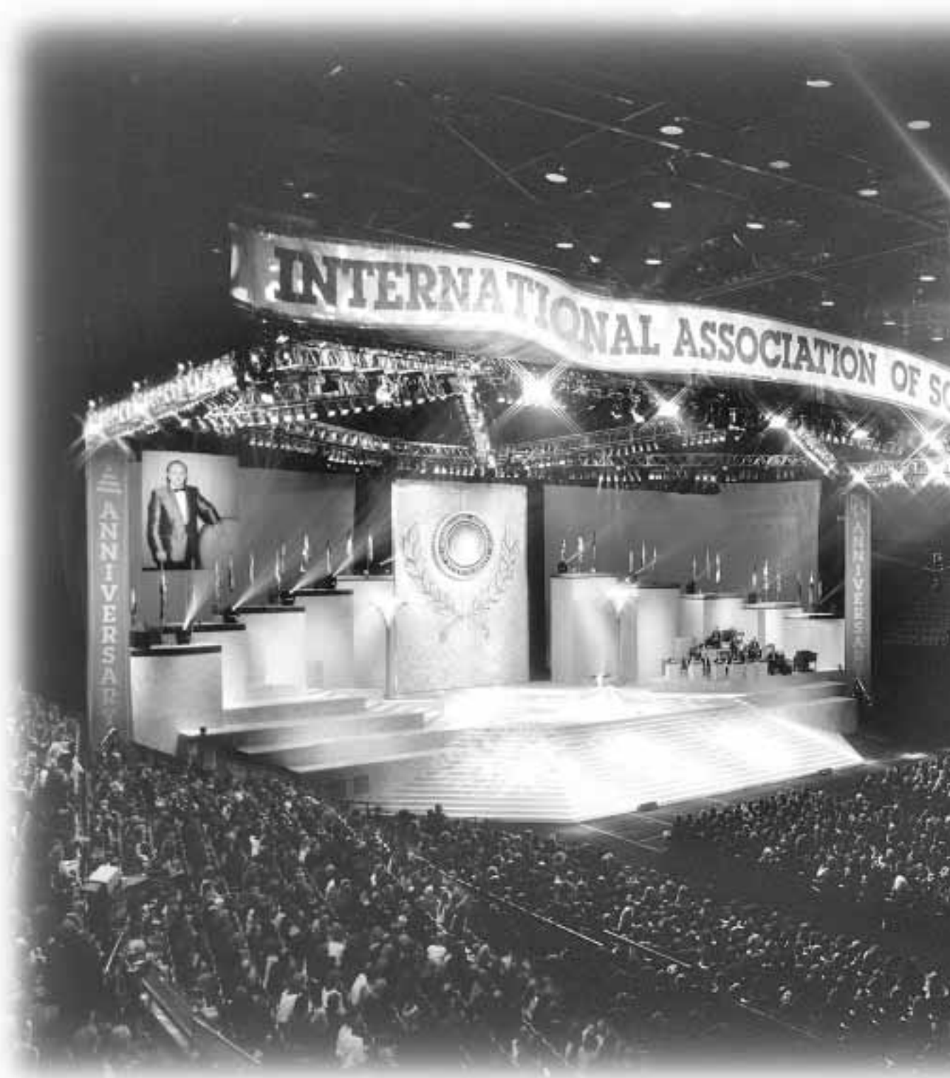
Den 8. oktober 1993 mødtes tusindvis af scientologer fra hele verden i Los Angeles for at høre nyheden om den historiske sejr for religionsfrihed.