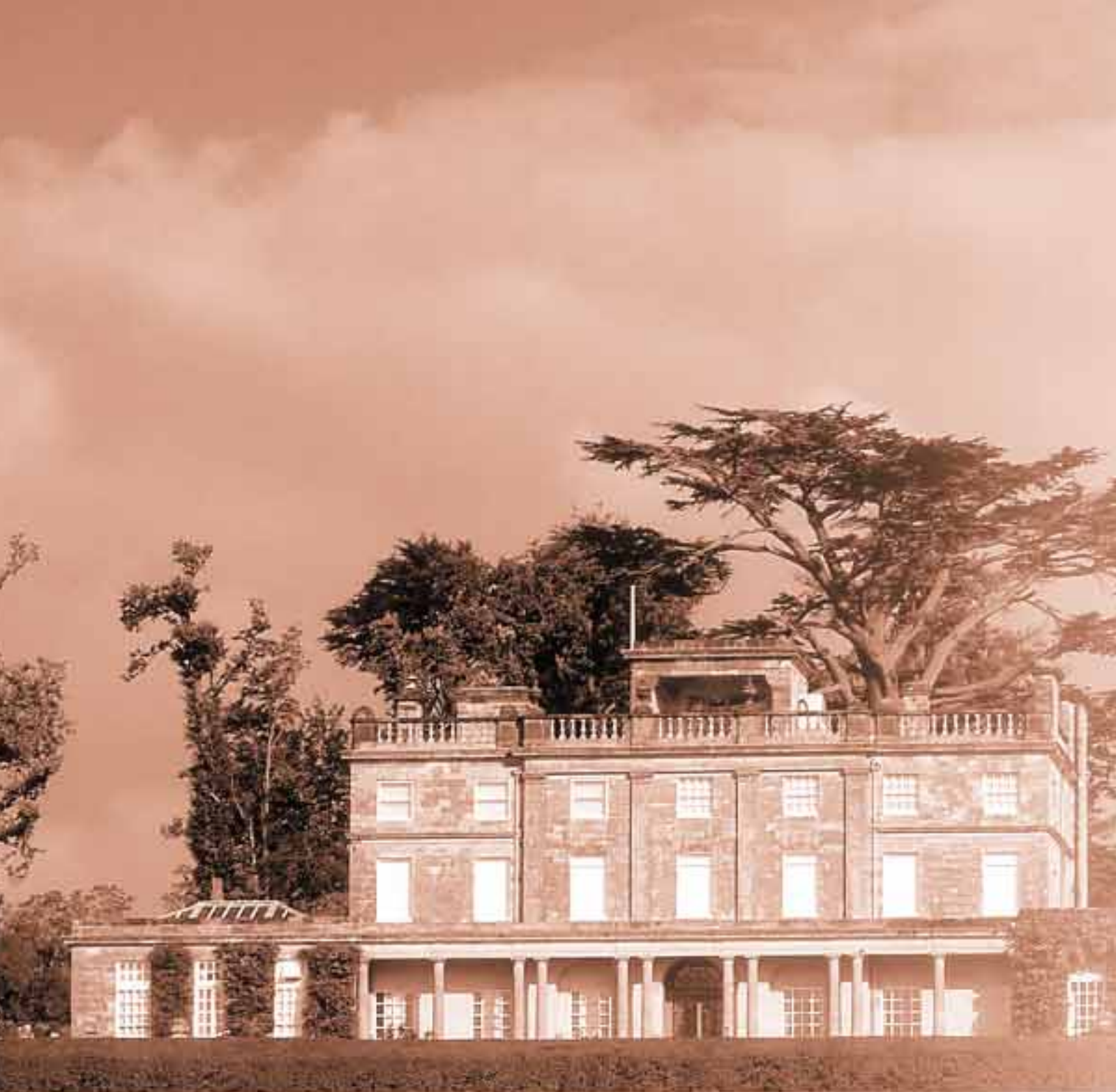
Saint Hill Manor i Sussex, England var L. Ron Hubbards hjem fra 1959 til 1966. Saint Hill blev også anvendt som Scientologi Kirkens internationale uddannelses- og administrationshovedkvarter.