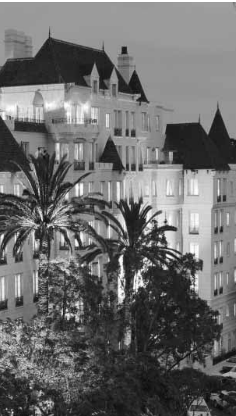
Scientologi Kirken Celebrity Centre International, som ligger midt i Hollywood, er en oase for kunstnere, der søger åndelig frihed gennem anvendelse af Dianetik og Scientologi læren.