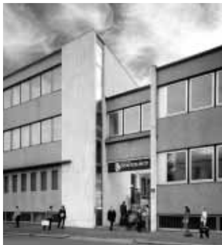
Scientologi Kirken i Milano