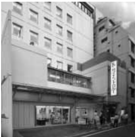
Scientologi Kirken i Tokyo