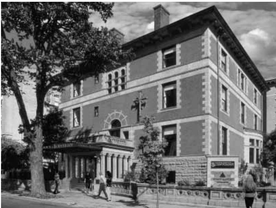
Den stiftende Scientologi Kirke i Washington, D.C., USA, er et åndeligt center for forretnings- og regeringsledere i nationens hovedstad.